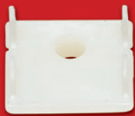
MA 75 DC