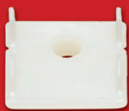
MA 75 DCO